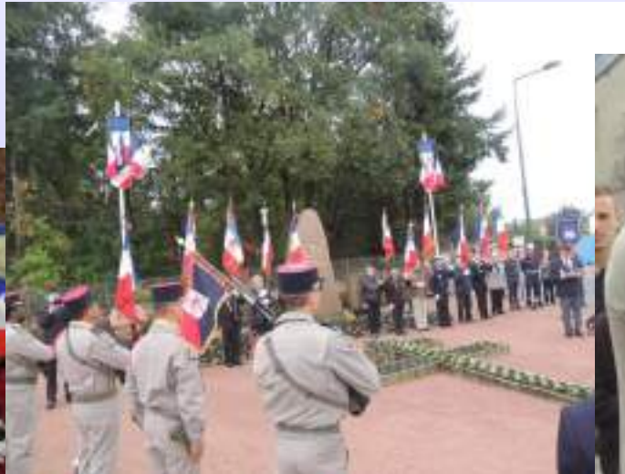
20 octobre Hommage au 152 e Régiment d'Infanterie « Les Diables Rouges » de Colmar