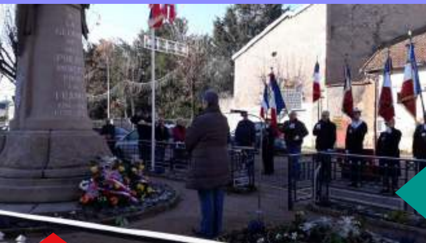
5 décembre Hommage aux "Morts pour la France" de la guerre d'Algérie et des combats du Maroc et de la Tunisie